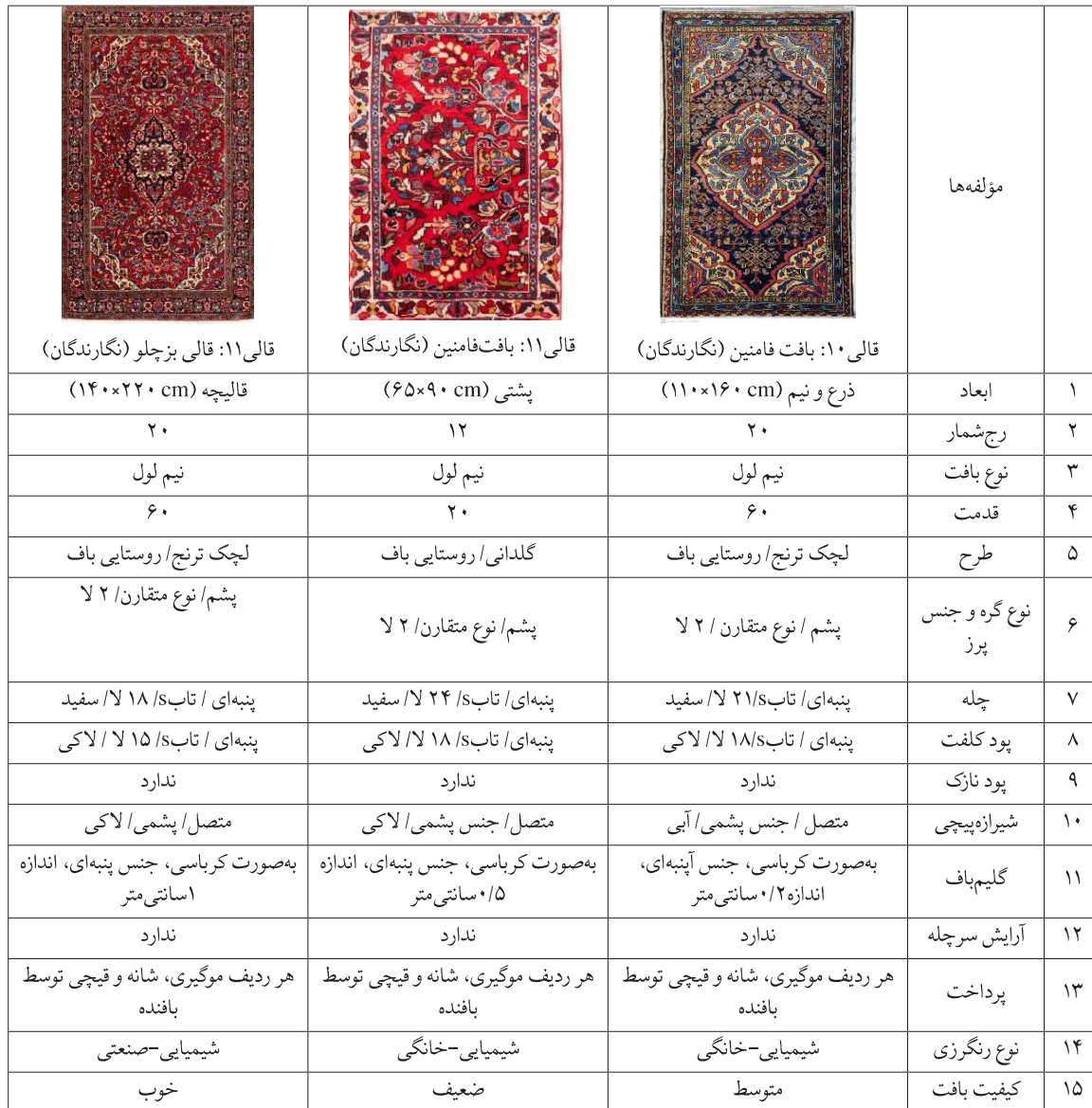
جدول ۵. قالی‌های درگزین «بافت روستاهای منطقه فامنین» و ویژگی‌های فنی آن (نگارندگان)

کاج و سلیلک بافته می‌شدند. در این میان، سوزن یکی از برترین مراکز تولید قالی در منطقه به شمار می‌آمد. امروزه آنچه به عنوان قالی درگزین در بازار همدان موجود است، یا متعلق به تولیدات گذشته همین منطقه است یا از روستاها و مناطق دورتر آمده و به نام درگزین عرضه می‌شود. در مقایسه با درگزین و مهربان، قالی‌های روستای بزچلو - واقع در جنوب درگزین - شهرت کمتری دارند (ژوله، ۱۳۸۱: ۱۹۷). به‌آذین نیز قالیچه‌های