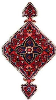
تصویر ۴. یکی از الگوهای رایج ترنج و سر ترنج.

ساختارهای رایج لچک، ترنج و حاشیه در قالی‌های درگزین در قالی‌های منطقه درگزین، طراحی لچک‌ها، ترنج‌ها، سرترنج‌ها، حاشیه‌ها و ترکیب‌بندی کلی متن، از الگوهای معین و نسبتاً تکرارشونده‌ای پیروی می‌کند که در بخش قابل توجهی از تولیدات منطقه مشاهده می‌شود. به عنوان نمونه، در تصاویر ۳ و ۴ به ترتیب یکی از ساختارهای شاخص در طراحی لچک، و نمونه‌ای رایج از ترنج و سرترنج ارائه شده است. این الگوها در دست‌کم پنج نمونه از مجموع هجده قالی مورد بررسی به کار رفته‌اند؛ موضوعی که بیانگر گستره کاربرد، مقبولیت و تثبیت این