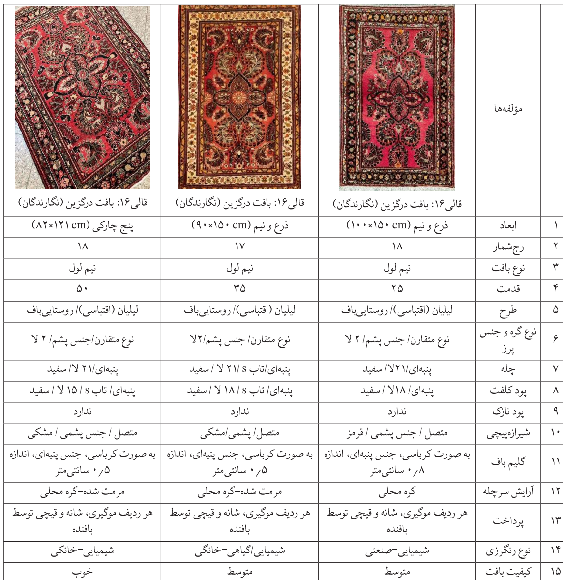
جدول ۷. قالی‌های درگزین «بافت روستاهای منطقه درگزین» و ویژگی‌های فنی آن (نگارندگان)

به شمار می‌روند. در شهرستان درگزین نیز شهر درگزین و روستاهای سوزن، سایان، درگزین علیا، درگزین سفلی، کاج، سیلک و سلیلک از مراکز اصلی قالی‌بافی محسوب می‌شوند (جدول ۶ و ۷).