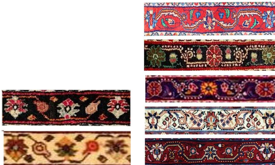
تصویر ۵. الگوی حاشیه بزرگ سمت راست (از بالا به پایین) قالی‌های شماره ۲، ۳، ۱۵، ۱۴، ۱؛ سمت چپ (از بالا به پایین) قالی‌های ۱۶، ۱۷

به دلیل هم‌جواری درگزین با مراکز مهم قالی‌بافی استان مرکزی،