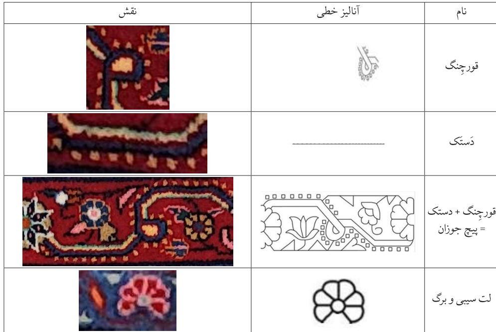
جدول ۸. نقوش متن و حاشیه اصلی و فرعی قالی سوزن (نگارندگان)

مثال زبندی قالی‌های لیلیان، ساختاری زمخت‌تر، هندسی‌تر به خود بگیرند. در واقع، این ویژگی‌ها بیانگر نوعی بازتعریف بصری نقوش هستند که ضمن حفظ اصول طراحی اصلی، ویژگی‌های بومی منطقه را نیز به خوبی منتقل می‌کنند.