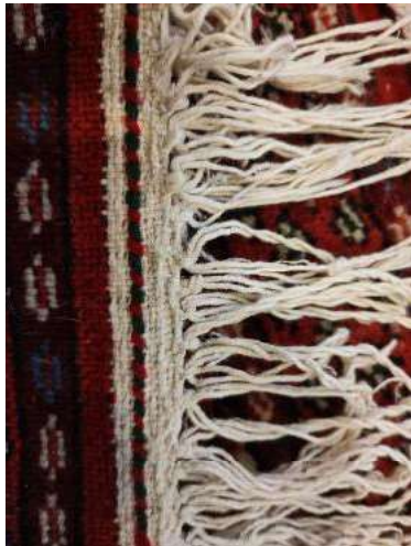
تصویر ۸ (چپ): گره محلی آرایش سرچله‌ها.

کاربرد نوعی رنگ سبز موسوم به «فراهانی» است که مختص منطقه بوده و این فام سبز در برگ‌ها بر روی متن قرمز قالی به شیوه‌ای خاص نمایان است که سبب جلوه بیشتر طرح و قالی می‌شود (جلیلیان، ۱۳۹۱: ۵۴). رنگ‌های اصلی در قالی‌های درگزین، بر پایه آنچه در اغلب نمونه‌های موجود قابل مشاهده است، شامل سرمه‌ای، قرمز و سفید هستند. رنگ‌های فرعی نیز شامل قهوه‌ای، صورتی، زرد، آبی و سبز می‌باشند. در مجموع، ترکیب و هم‌نشینی رنگ‌هایی مانند آبی و قرمز، قرمز و سرمه‌ای، سبز و قرمز و همچنین لاک‌ی و صورتی، بیش از سایر رنگ‌ها در قالی‌های این ناحیه رواج داشته است.