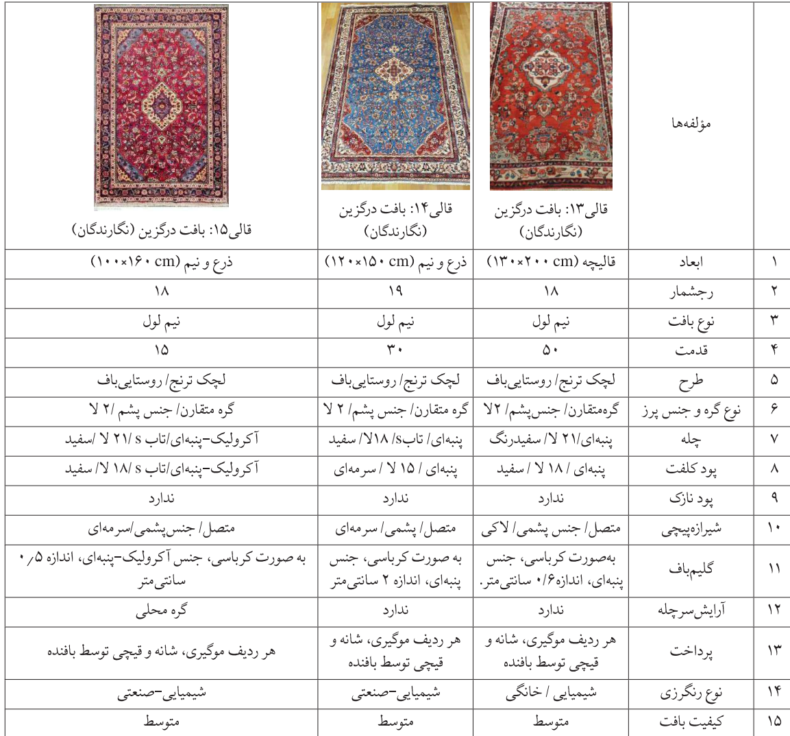
جدول ۶. قالی‌های درگزین «بافت روستاهای منطقه درگزین» و ویژگی‌های فنی آن (نگارندگان)

ساماندهی، نظارت و حمایت از بافندگان و جذب علاقه‌مندان، امری ممکن و ضروری است؛ چراکه این مناطق پیش‌تر از صادرکنندگان قالی در سطح کشور بوده‌اند.