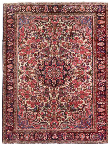
قالی ۹. طرح بزچلو بافت فامنین.