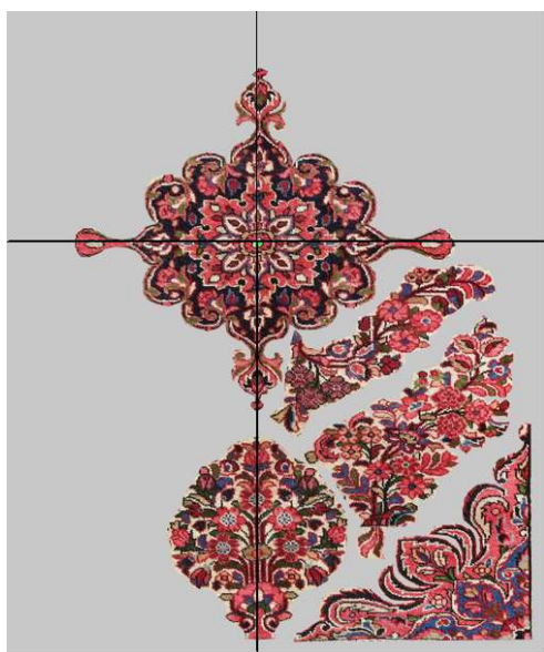
تصویر ۶. آنالیز و تفکیک فضای متن قالی شماره ۹.

مردم درگزین برای بافت قالیچه‌های خود از پشم گوسفندان