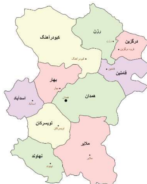
تصویر ۲. نقشه و محدوده جغرافیایی استان همدان

درباره منشأ نام «رزن» دیدگاه‌های مختلفی مطرح شده است. یکی از رایج‌ترین روایت‌ها، نام این منطقه را برگرفته از واژه «رزان» می‌داند که به دلیل فراوانی باغ‌های انگور در گذشته به این نام شهرت یافته بود؛ واژه «رَز» در فارسی به معنای انگور است. به‌مرور زمان، «رزان» به «رازان» و سپس به «رزن» تغییر شکل یافته است. در روایتی دیگر، این نام از واژه «رایزن» گرفته شده که در برخی منابع به معنای میزبان یا مهماندار آمده است. نظریه‌ای متفاوت نیز وجود دارد که نام رزن را با واژه «راهزن»