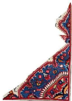
تصویر ۳. یکی از الگوهای رایج طراحی لچک.

بوده‌اند، اما در دوره‌ای که تولید آنها برای بازار نیویورک انجام می‌شد، سلیقه آمریکایی‌ها تأثیر چشم‌گیری بر نقوش منطقه گذاشت و باعث شد نقش و رنگ قالیچه‌ها به صورت یکنواخت درآید. همچنین بنا بر سلیقه مشتریان آمریکایی، پرز قالیچه‌ها بلند بریده می‌شد (به‌آذین، ۱۳۴۴: ۸۶).