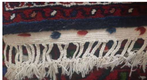
تصویر ۷. گلیم‌باف رایج در قالی‌های درگزین (نگارندگان)

از دیگر ویژگی‌های خاص رنگی در قالی‌های بزرچلو،