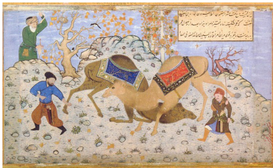
تصویر ۴. نزاع شتران، مرقع گلشن، تبریز، حدود ۹۳۰ ه.ق، کتابخانه کاخ گلستان، تهران (آژند، ۱۳۸۹: ۱۳۱).

یکی از ویژگی‌های افراد خودشکوفای خبرگی در تجربه‌های اوج (تصوف) است. بر اساس روان‌شناسی شخصیت، این افراد به دو دسته اوج‌گرا و غیر اوج‌گرا تقسیم می‌شوند. از دیدگاه مزلو، خودشکوفایان اوج‌گرا بیشتر حالتی تقدس و شاعرانه دارند و تجربه‌های آنان عمدتاً صوفیانه و مذهبی هستند (مزلو، ۱۳۷۵