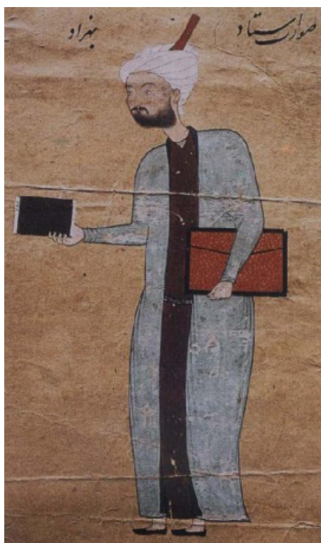
تصویر ۹. بهزاد در سن حدود ۶۰ سالگی، حدود ۹۳۰ ه.ق، کتابخانه دانشگاه استانبول (آژند، ۱۳۸۹: ۲۸).