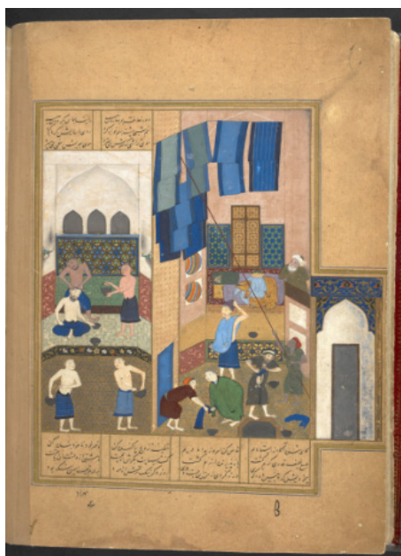
تصویر ۸. خلیفه هارون در حمام، خمسه نظامی، هرات، حدود ۸۹۹ ه.ق، کتابخانه بریتانیا، لندن (آژند، ۱۳۸۹: ۳۰).