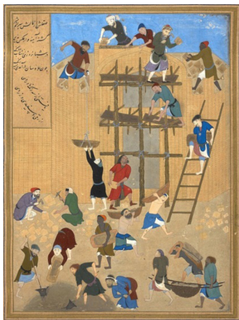
تصویر ۲. ساختن کاخ خورنق، خمسه نظامی، هرات، حدود ۹۰۰ ه.ق، کتابخانه بریتانیا، لندن (آژند، ۱۳۸۹: ۳۰۸).

برخی معتقدند که انسان‌های خودشکوفایان توانایی همدردی و عطف نسبت به دیگران دارند. روان‌شناسان بر این باورند که این ویژگی‌ها در فرایند تکامل انسانی به دلیل نیاز به همکاری در برابر چالش‌های مشترک توسعه یافته‌اند و می‌توانند به ایجاد ارتباطات اجتماعی عمیق‌تر کمک کنند. باین‌حال، میزان همدردی افراد متفاوت است و شرایطی مانند خشم یا بی‌زاری می‌تواند این احساس را کاهش دهد. عوامل مانند تربیت و تجربه‌های زندگی نیز بر سطح همدردی تأثیرگذارند. درنهایت، درک و همدردی با دیگران از عوامل مهم در ارتباطات انسانی است (مزلو، ۱۳۷۵: ۲۳۱). نگاره «ساختن خورنق» اثر کمال بهزاد به‌خوبی ویژگی‌های افراد خودشکوفایان را نشان می‌دهد. (تصویر ۲) این نگاره نسخه‌ای از خمسه نظامی است که اینک در کتابخانه بریتانیا نگهداری می‌شود، نگاره‌ای از دوران تیموری حدود ۹۰۰ ه.ق به تصویر کشیده شده که فعالیت افراد و حس همدردی بهزاد را نشان می‌دهد. او با نمایش واکنش‌ها و حالت