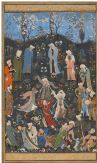
تصویر ۵. سماع صوفیان، دیوان جامی، هرات، حدود ۸۹۵ ه.ق، موزه متروپولیتن، نیویورک (آژند، ۱۳۸۹: ۳۸۱-۳۸۲).

افراد خودشکوفای به دنبال روابط عمیق‌تر و سازنده‌تری هستند که به رشد و توسعه فردی آنها کمک کند. آنها به دوستانی علاقه‌مندند که چالش‌ها و حمایت روحی ارائه دهند و از لحاظ روحی پخته‌تر باشند. این افراد تمایل دارند با کسانی دوست شوند که به ارزش‌ها و نگرش‌های آنها احترام قائل هستند و در مسیر پیشرفت همراه این افراد می‌باشند (کریمی، ۱۳۹۵: ۱۵۶). به سبب استعداد هنری کمال‌الدین بهزاد و همچنین به دلیل هم‌نشینی او با بزرگانی چون عبدالرحمن جامی و میرعلیشیر نوایی وی مورد احترام و حمایت حاکمان تیموری و صفوی و نیز از بکان قرار داشت (آژند، ۱۳۸۹: ۳۶۸-۳۶۹). بهزاد با دوستی و بهره‌گیری از تجربیات افراد در دربار و خارج از آن، در مسیر رشد و استعداد خود گام برداشته است. این ویژگی به احترام میان فردی مربوط می‌شود، زیرا پیوندهای عمیق‌تر موجب افزایش احترام می‌شود. او با درآویش و مردم عادی ارتباط برقرار کرده و در نگاره «ساختن کاخ خورنق» از فعالیت‌های روزمره مردم بهره گرفته است. این امر نشان‌دهنده درک او از واقعیت، مردم‌سالاری و پیوندش با دیگران از طریق زبان نقاشی است.