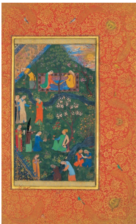
تصویر ۱. سلطان حسین میرزا در گلگشت، مرقع گلشن، هرات، حدود ۸۹۵ ه.ق، کتابخانه کاخ گلستان، تهران (آزند، ۱۳۸۹: ۳۰۳).

دست می‌یابند و معمولاً از الگوهای عمومی و تقلیدی خارج می‌شوند تا راهکارهای نوآورانه پیدا کنند. همچنین، آنها سلامت روانی بیشتری دارند و به خوبی با فشارهای روزمره سازگار می‌شوند (مزلو، ۱۳۷۵: ۲۱۶-۲۱۹). کمال‌الدین بهزاد در نگاره‌های خود بیشتر به واقعیت بصری فرد و انسان تأکید دارد، عناصر انسانی به‌کاررفته در آثار بهزاد بیشتر در حالت انجام فعالیت بازگو شده‌اند. علاقه‌مندی بهزاد به بازنمایی واقعی انسان و صحنه‌های زندگی روزمره، باعث شده است صحنه‌ها و مجالسی را تصویر نماید که برای مردمان قرن نهم هجری جامعه هرات بسیار واقعی به نظر می‌رسیدند. نگاره «سلطان حسین میرزا در گلگشت» (تصویر ۱) نسخه‌ای از مرقع گلشن محفوظ در کتابخانه کاخ گلستان ۱ است. این نگاره در حدود ۸۹۵ ه.ق و در دوران تیموری مصورسازی شده است. یکی از نمونه‌های واقع‌گرایی در این نگاره‌ها، داستان تصویری بهزاد از پیکر سلطان حسین میرزا در یک صحنه ضیافت و گلگشت است. در نگاره «تدارک ضیافت» اثر بهزاد، پیکره‌ها در مشاغل مختلف به کار مشغولند و فضا بندی نگاره در طبیعت با یک