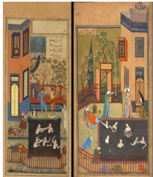
تصویر ۳. آب‌تنی، خمسه نظامی، هرات، حدود ۹۰۰ ه.ق، کتابخانه بریتانیا، لندن (آژند، ۱۳۸۹: ۳۱۳).

افراد خودشکوفای ویژگی‌هایی چون سادگی، فطری بودن و حفظ