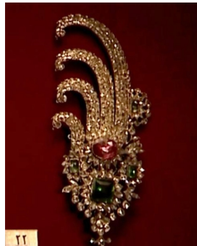
تصویر ۱۰. جقه طلا مزین به الماس، یاقوت و زمرد. متعلق به دوران فتحعلی‌شاه (URL 3)