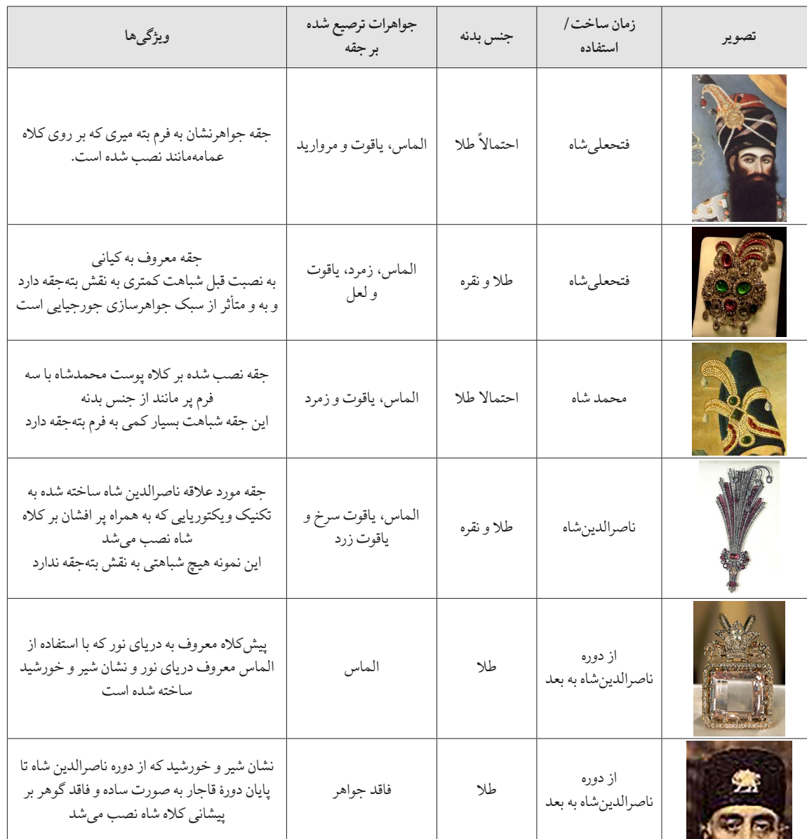
جدول ۱. فرم و ویژگی‌های مورد استفاده در دوره قاجار (نگارنده)

دارد. این جقه‌ها معروف به بته قاجاری بودند، و به لحاظ فرم به بته میری یا سرابندی شباهت داشتند، و این امر رابطه متقابل نقش سرو و نگاره معروف به بته جقه را نمایان می‌سازد. نقش سرو در ابتدا به صورتی بوده که باغی را در خود جای می‌داده است، به تدریج حلیت بیرونی-درونی و رابطه محیطی و محاطی آن تغییر کرده و به شکل بته جقه در آمده است. این نقش را به دلیل شباهت آن به میوه گلابی، بته گلابی نیز می‌نامند (نادری،