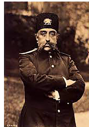
تصویر ۷. مظفرالدین‌شاه قاجار با کلاهی مزین به نشان شیر و خورشید (URL 6)