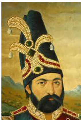
تصویر ۴. پرتره محمدشاه قاجار با کلاه پوست مزین به جقه جواهرنشان (URL 4)

فتحعلی‌شاه اندکی پس از آغاز سلطنتش فرمان داد تا تاجی از جنس طلا و گوهرنشان ساختند و هرساله در مراسم سلام‌های رسمی و اعیاد آن را به سر می‌کرد. در واقع آن تاج کیانی معروف دوره قاجار که اکنون در دست است، همان تاجی است که به دستور فتحعلی‌شاه ساخته شد (امانت، ۱۳۹۸: ۱۷). همه سلاطین قاجار پس از فتحعلی‌شاه نیز در تاج‌گذاری‌های خود از همین تاج کیانی استفاده می‌نمودند (شیخی و میرصانع، ۱۳۹۸: ۳۷)؛ با این تفاوت که در زمان سلطنت ناصرالدین‌شاه [یا مظفرالدین‌شاه] جقه‌ای بزرگ مزین به زمرد و الماس و پره‌های متعدد و یک رشته مروارید به این تاج اضافه شد و اندکی تغییر در نحوه نصب جواهرات آن ایجاد گردید (بلالی و رحمانی، ۱۳۹۹: ۲۱).