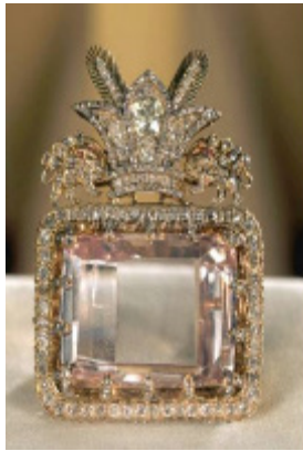
تصویر ۸. پیش‌کلاه سلطنتی دریای نور همراه با نشان شیر و خورشید بر بالای آن

بسیار تحت تأثیر تکنیک‌های جواهرسازی این دوره قرار داشته است. لازم به ذکر است که بیشترین و کامل‌ترین مجموعه جقه و پیش‌کلاه سلطنتی این دوره که اکنون در خزانه جواهرات ملی ایران نگهداری می‌شود، متعلق به دو پادشاه، یعنی فتحعلی‌شاه و ناصرالدین‌شاه قاجار است. در حقیقت هنردوستی و علاقه فراوان این دو پادشاه به ساخت و جمع‌آوری جواهرات قیمتی، سبب شد تا در این دوره تعداد زیادی جواهرات سلطنتی از جمله جقه و پیش‌کلاه برای این دو شاه ساخته و یا به آنها پیشکش شود. علاوه بر این گنجینه ملی، تعداد زیادی پرتو نقاشی شده و همچنین عکس (از دروه ناصرالدین‌شاه به بعد)، و اسناد مکتوب بسیاری از جمله توصیفات سیاحان خارجی از زمان دو پادشاه مذکور در دست است که بر مبنای آن، می‌توان سیر تحول جقه و پیش‌کلاه‌های این دوره را بررسی نمود.