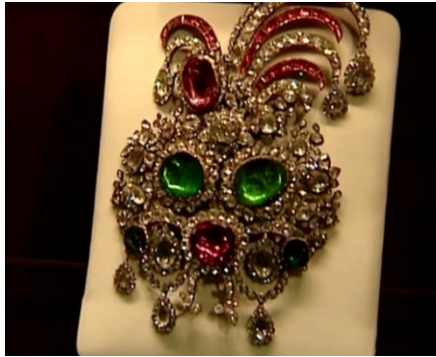
تصویر ۳. جقه کیانی ساخته شده در زمان فتحعلی‌شاه قاجار (URL 3)

ظاهراً محمدشاه، جانشین فتحعلی‌شاه، برخلاف پدر بزرگ‌اش علاقه‌ای به ثبت پرتره‌های متعدد از خود نداشته است، لذا تصاویر قابل توجهی از دوره پادشاهی وی باقی نمانده است تا بتوان به طور دقیق در مورد نحوه تزیینات سرپوش او اظهار نظر کرد. اما معدود تصاویر برجای مانده گواه این است که این شاه قاجاری نیز همواره تاج و کلاه خود را به پیش‌کلاه یا جقه جواهرنشان مزین می‌کرده است. در «تصویر ۴» نیم‌تنه محمد شاه با لباسی نیمه اروپایی به تصویر کشیده شده، اما سرپوش وی