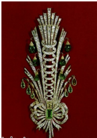
تصویر ۱۱. جقه متعلق به ناصرالدین‌شاه و مزین به الماس و زمرد (URL 9)

۲. جقه (یا پیش‌کلاه)های ساخته شده به سبک اروپایی: این گروه از جقه‌ها شامل قطعاتی هستند که در ساخت آن از تکنیک‌های جواهرسازی فرنگی استفاده شده است. با شروع روابط دیپلماتیک جدید در اوایل دوره قاجار و زمان سلطنت فتحعلی‌شاه، تبادلات بسیاری مابین دربار ایران و سایر ممالک جهان، خصوصاً کشورهای اروپایی، صورت می‌پذیرد، که یکی از این موارد، پیشکش‌های جواهرنشان به دستگاه سلطنت وقت ایران بوده است. با ورود چنین هدایایی، ایرانیان در مواجهه مستقیم با جواهرات ساخت فرنگ قرار گرفته و در برخی موارد فرم، مضامین، فنون و شیوه‌های ساخت و تزیین این جواهرات نو ورود، دست‌مایه تقلید جواهرسازان ایرانی می‌شود. اوج ساخت