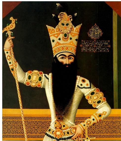
تصویر ۲. فتحعلی‌شاه قاجار با تاج معروف کیانی (URL 2)

به گفته شهشهبانی (۱۳۹۶) سرپوش فتحعلی‌شاه و آنچه نشان شاه بودن اوست، جقه‌ای است جواهرنشان که بر بالای تاج او نصب شده و نشان دیگر دو بازوبندی است که بر بازوی راست و چپ خود بسته است (۴۵). در «تصویر ۲»، فتحعلی‌شاه قاجار با تاج کیانی جواهرنشان که مزین به جقه است، نشان داده می‌شود. جقه نصب شده بر روی تاج کیانی در این تصویر، به «جقه کیانی» معروف است و اکنون در خزانه ملی جواهرات نگهداری می‌شود. این جقه به دستور شخص فتحعلی‌شاه ساخته شد و ظاهراً جقه مورد علاقه وی بوده است؛ چراکه در بسیاری از پرتره‌ها این نمونه بر پیشانی تاج کیانی نصب شده است، و اغلب