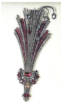
تصویر ۶. پیش‌کلاه سلطنتی متعلق به ناصرالدین شاه (آرشیو خزانه جواهرات ملی ایران)

همان کلاه پوست بره متداول در دوره قاجار است. در این پرتوه جقه‌ای نسبتاً بزرگ بر سمت راست کلاه نصب شده که مزین به الماس، یاقوت و زمرد است. در قسمت بالای این نمونه، سه فرم پَرمانند اما از همان جنس جواهر و نه پر، قرار دارد که از هر یک جواهری (احتمالاً الماس یا مروارید) آویزان شده است. فرم ظاهری این جقه بسیار کمتر از نمونه‌های پیشین به نقش مایه بته‌جقه شباهت دارد.