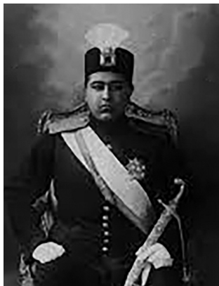
تصویر ۹. احمدشاه قاجار با کلاهی مزین به الماس دریای نور (URL 7)

فنون ساخت و تزئین پیش‌کلاه‌ها و جقه‌ها در دوره قاجار،