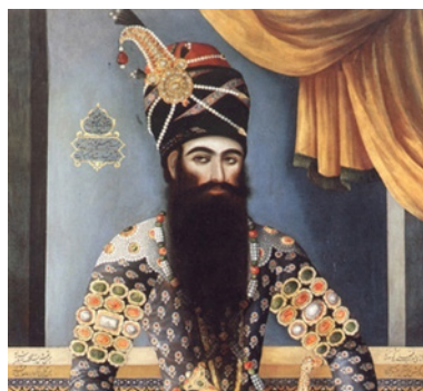
تصویر ۱. فتحعلی‌شاه قاجار در آغاز سلطنتش با کلاهی عمامه‌مانند و مزین به جقه جواهرنشان (URL 1)

در میان همه پادشاهان این سلسله، فتحعلی‌شاه بیشترین میزان تاج را دارا بوده، و انواع مختلفی از آن را بر سر می‌نهاد. البته تمامی این سرپوش‌ها را نمی‌توان تاج نامید؛ بلکه در واقع نوعی تاج-کلاه هستند. در اولین نقاشی کشیده شده از فتحعلی‌شاه قاجار که اندکی پس از آغاز سلطنت وی توسط میرزا بابای شیرازی ترسیم شده است، شاه جوان با یک کلاه عمامه‌مانند تصویر شده که به یک جقه مزین است (تصویر ۱). این جقه جواهرنشان به فرم بته معروف به میری (بته سرابندی و بته قاجاری) ساخته شده و آن‌گونه که در تصویر قابل تشخیص است، مزین به الماس، یاقوت و مروارید است. پرتره‌های متعددی از این پادشاه هنردوست وجود دارد که او را با کلاه عمامه‌مانند یا کلاه پوست‌نشان می‌دهد، درحالی‌که جقه‌ای جواهرنشان مشابه نمونه «تصویر ۱»، برای زینت به آن نصب شده است.