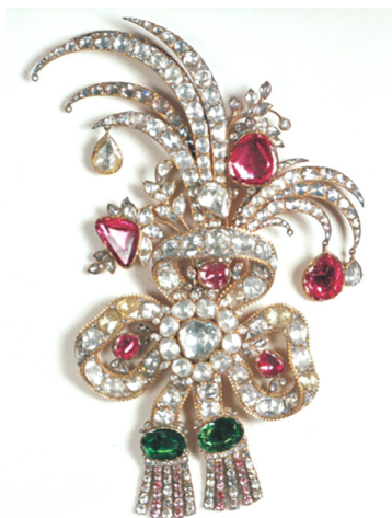
تصویر ۱۲. جقه سلطنتی پیشکشی

اضافه گردیدند. ویژگی‌های غالب این پیش‌کلاه‌های نیز از سبک جواهرسازی جورجیایی و ویکتوریایی تبعیت می‌کند. فلز مورد استفاده در ساخت نمونه‌ها، طلا است. گوهرهای ترصیع شده شامل الماس، یاقوت سرخ و کبود، و زمرد است. به لحاظ فرم نیز در نمونه‌های این گروه، هم جقه‌هایی با فرم بته‌جقه دیده می‌شود، و هم پیش‌کلاه‌های ساخته شده با فرم‌های متأثر از سبک جواهرسازی جورجیایی و ویکتوریایی همچون روبان و گل زنبق (تصویر ۳).