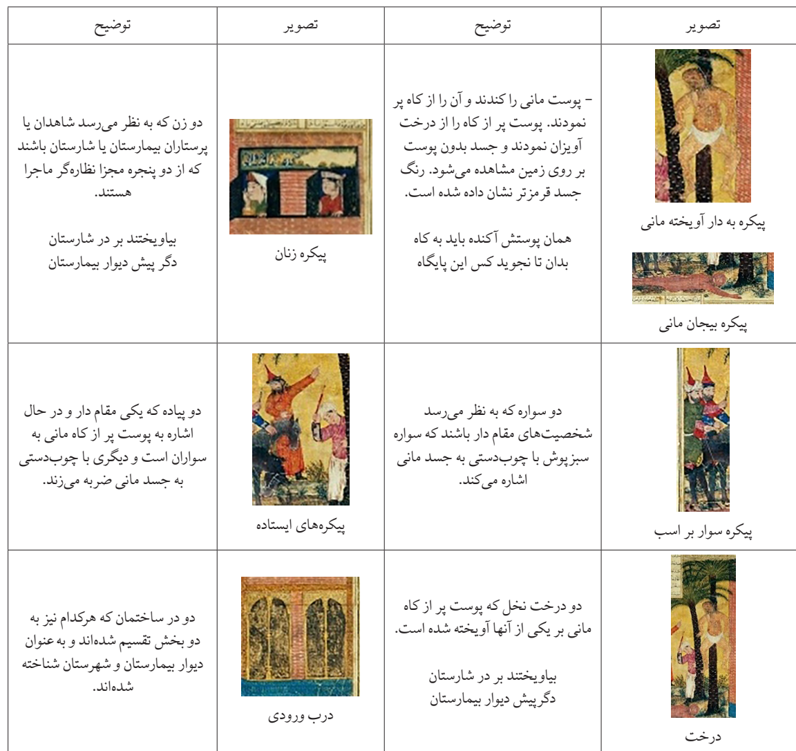
جدول ۱. عناصر نگاره به دار آویختن مانی در شاهنامه بزرگ ایلخانی

تحقیقات و پژوهش‌هایی در مورد زندگی مانی و آیین او انجام شده است. دکره (۱۳۸۰)، در کتاب خود با عنوان مانی و سنت مانوی، به زندگی مانی، آیین پدرانش، کیش مانوی و چگونگی