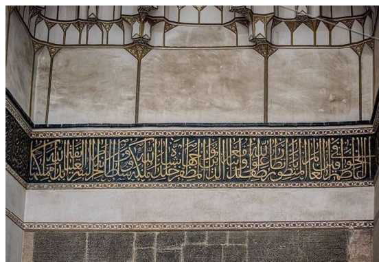
تصویر ۱. کتیبه ۱، سردر ورودی مسجد میرعماد کاشان (نگارندگان).

جدول ۱. ویژگی‌های تاریخی، ساختاری و نوشتاری کتیبه ۱.