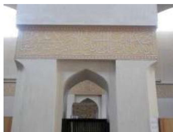
تصویر ۱۷. کتیبه داخل شبستان.

جدول ۱۹. ویژگی‌های تاریخی، ساختاری و نوشتاری کتیبهٔ ۱۹.