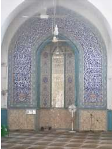
تصویر ۲۵. کتیبه‌های محراب جدید (نگارندگان).

جدول ۲۷. ویژگی‌های تاریخی، ساختاری و نوشتاری کتیبه ۲۷.