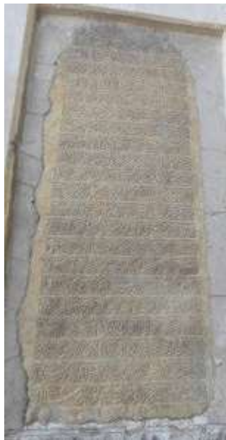
تصویر ۱۲. کتیبه فرمان نادری به تاریخ ۱۱۴۳ هـ.ق، نگارندگان.

۱۲. کتیبهٔ ۱۴. این کتیبه به فرمان نادری مشهور است زیرا این کتیبه متعلق به زمان شاه طهماسب دوم صفوی و مقارن با فتوحات نادر و ورود او به کاشان است. این فرمان به خط نستعلیق بر روی سنگ سفید نقر شده و مورخ به سال ۱۱۴۳ هـ.ق است (تصویر ۱۲). این فرمان در بالای فرمان شماره ۱۰ نصب شده است» (نراقی، ۱۳۸۲: ۱۶۱). این فرمان در باب امحاء آثار بدعت است. (جدول ۱۴)