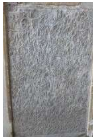
تصویر ۱۳. کتیبه فرمان شاه صفی ابن صفی میرزا به تاریخ ۱۰۴۸ هـ.ق (نگارندگان).

گروه سوم: کتیبه‌های حاوی پیام‌های دینی مذهبی و تزئینی تکرار فراوان کتیبه‌های برگرفته از قرآن کریم بر روی دیوارهای مساجد و سایر ابنیه، به انسان یادآوری می‌کند که تار و پود حیات اسلامی از آیات قرآن تنیده شده و از لحاظ معنوی متکی بر قرآنت قرآن و نماز است. «اگر بتوان فیضی را که از قرآن کریم سرچشمه می‌گیرد یک ارتعاش معنوی خواند، باید گفت که تمامی هنر