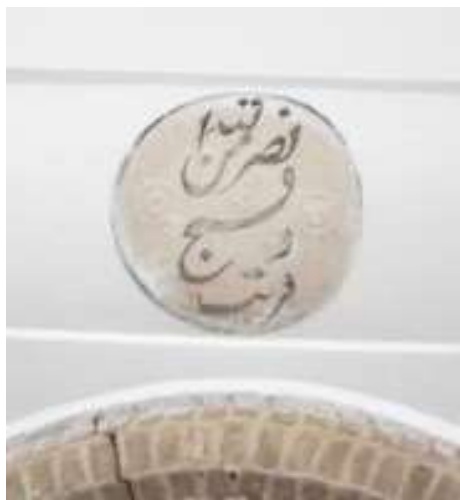
تصویر ۲۳. کتیبه بالای فرمان شاه عباس اول (نگارندگان).

۲۵۰ سال بعد به عصر خواجه عمادالدین شیروانی بانی مسجد رسیده باشد. «این محراب از جهت ظرافت و زیبایی و دقایق فنی منحصر به فرد است چنانکه بیشتر سیاحان و ایران شناسانی که به کاشان سفر کرده و محراب عظیم این مسجد را از نزدیک دیده‌اند از آن به زیبایی و شگفتی یاد کردند» (رجبی، ۱۳۹۰: ۱۴۸). البته نظرات مختلفی برای این محراب وجود دارد. واتسون در کتاب سفال زرین‌فام اشاره می‌کند که: «این محراب نمی‌بایستی برای چنین بنایی ساخته شده باشد. از این رو که اسکلت بندی کنونی این بنا نمی‌تواند به قبل از قرن نهم تعلق داشته باشد. بی‌شک این محراب را از ساختمان دیگری به آنجا آورده و در قرن نهم هجری یا بعدتر نصب شده است» (واتسون، ۱۳۸۲: ۲۷۲). این محراب با آیاتی از قرآن مجید از جزء سی به خط کوفی، رفاع و ثلث تزئین شده است. (جدول ۲۶) (تصویر ۲۴).