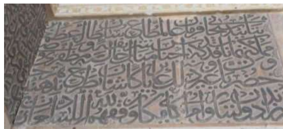
تصویر ۳. فرمانشاه جهانشاه و همسرش، به تاریخ ۸۶۹ هـ.ق (نگارندگان).

۲. کتیبه ۴. این کتیبه فرمانی از شاه طهماسب اول است. «کتیبه‌ای در بالای صفا راست جلوخان مسجد به نام شاه طهماسب اول صفوی، مورخ به سال ۹۳۲ هـ.ق است که با خط نستعلیق بر روی سنگ نقر شده است» (مشکوتی، ۱۳۴۶: ۸). (تصویر ۴) در این فرمان موارد رفع ظلم، برقراری عدالت، برانداختن بدعت در دین اسلام و منع پرداخت مالیات ذکر شده است. (جدول ۴)