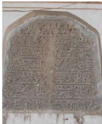
تصویر ۲۶. کتیبه مرمتی دوره فتحعلیشاه قاجار که زیر کتیبه فرمان شاه طهماسب به تاریخ ۱۲۴۳ نصب شده است.

جدول ۳۰. ویژگی‌های تاریخی، ساختاری و نوشتاری کتیبه ۳۰.