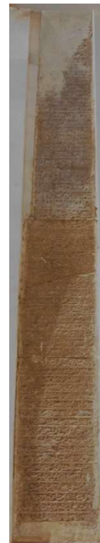
تصویر ۱۱. فرمان شاه سلطان حسین به تاریخ ۱۱۰۶ هـ.ق (نگارندگان).