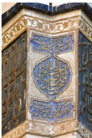
تصویر ۲. کتیبه گچی فوقانی دو طاق‌نما (نگارندگان).

حداصل مصرع اول و دوم عبارتی عربی نوشته شده که تاکنون خوانده نشده است. این عبارت برای اولین بار توسط استاد ناصر میزبانی ۱ خوانش شده و در این مقاله ذکر شده است. در این کتیبه آمده: «اعمل اقل خلق الله حیدر بنا» (تصویر ۲) (جدول ۲).