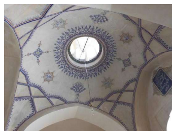
تصویر ۱۵. کتیبه داخل هشتی (نگارندگان).

۵. کتیبهٔ ۲۰. در قسمت سردر ورودی زنانه کتیبه‌ای وجود دارد که فقط قسمت کوچکی از آن باقیمانده است. «در مورد تزیینات دیگر این مسجد می‌توان به رسمی بندی سقف و نیمکار ایوان اشاره کرد که دور تا دور آلات این رسمی بندی به صورت حمیل، نقاشی آبرنگ شده است. همچنین کتیبه گچبری، به خط ثلث بسیار زیبا