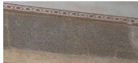
تصویر ۵. کتیبه شاه طهماسب اول، به تاریخ ۹۴۱ هـ ق (نگارندگان).

۵. کتیبه ۷. این کتیبه فرمان دیگری از شاه طهماسب اول است که تاریخ ۹۸۱ هـ ق بر روی آن نقر شده است. (تصویر ۷) این فرمان بر روی سنگ سیاه و با خط نستعلیق و مربوط به رفع ظلم و ستم و رفع بدعت در دین است (مشکوتی، ۱۳۴۵: ۱۱). (جدول ۷)