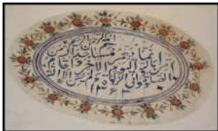
تصویر ۱۶. کتیبه زیر ایوان.

جدول ۱۸. ویژگی‌های تاریخی، ساختاری و نوشتاری کتیبهٔ ۱۸.