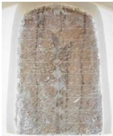
تصویر ۱۰. فرمان شاه عباس اول، به تاریخ ۱۰۳۳ هـ.ق.

۱۰. کتیبه ۱۲. این کتیبه فرمانی مربوط به شاه عباس اول صفوی به تاریخ ۱۰۳۳ هـ.ق است که در بالای در پشتی صحن مسجد نصب شده است. این کتیبه تاریخی، بر روی سنگ نقش بسته و منظوم است. عبارت «الله ربی و التوفیق و نستعین بالله» در ابتدای این شعر آمده است (تصویر ۱۰). «به فرمان شاه عباس کبیر در آنجا ساختمان‌هایی جهت سکونت و پذیرایی از واردین و ساکنین این مسجد به نام مسکن خیر بنا کرده‌اند که با اسباب و لوازم زندگانی دایر بوده است» (نراقی، ۱۳۸۲: ۱۶۹). (جدول ۱۲) ۱۱. کتیبه ۱۳. این کتیبه فرمانی متعلق به شاه سلطان حسین صفوی به خط نستعلیق و مورخ به سال ۱۱۰۶ هـ.ق است. «این فرمان در داخل صحن مسجد بر روی یک قطعه سنگ مرمر بطول حدوداً ۳ متر در ۰/۵ متر نقر شده است که در باب منع اعمال شنیع و اعمال مجازات سنگین برای آن است» (نراقی، ۱۳۸۲، ۱۶۷). این فرمان همزمان با سال اول جلوس شاه سلطان حسین داخل مسجد نصب