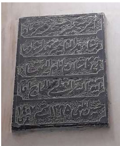
تصویر ۲۹. کتیبه مرمتی داخل مسجد با سنگ مرمر سیاه (نگارندگان).

متداول‌ترین کتیبه‌ها در مسجد میرعماد کاشان، کتیبه‌های مذهبی با مضامین قرآنی هستند. جزء سی ام قرآن به دلیل کم حجم بودن آیات و جایگیری مناسب‌تر در داخل مسجد و به طور متسلسل، با هنرگچکاری و به صورت برجسته، مزین و