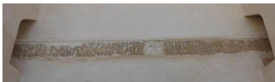
تصویر ۱۹. کتیبه‌های ایوان (نگارندگان).

جدول ۲۱. ویژگی‌های تاریخی، ساختاری و نوشتاری کتیبه ۲۱.