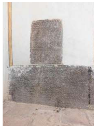
تصویر ۹. فرمان منظوم شاه عباس کبیر به تاریخ ۱۰۰۲ هـ.ق و متن فرمان شاهانه (نگارندگان).

۹. کتیبه ۱۱. این کتیبه به «فرمان شاهانه» معروف است. متن فرمان شاهانه به خط نستعلیق در زیر اشعار بالا حجاری شده است. فرمانی که در جز سمت چپ مدخل مسجد است و تاریخ آن قابل خواندن نیست، لیکن به استناد مفاد آن باید تاریخ آن هم زمان با سال فرمان شماره ۸ باشد. «این دو کتیبه بر روی هم قرار گرفته‌اند (کتیبه پایینی «تصویر ۹»). خط آن نستعلیق ریز، در هشت سطر و در یک قطعه سنگ سیاه به عرض ۹۰ و ارتفاع ۴۵ سانتی متر نقر شده است. مفاد آن مربوط به خریداران، فروشندگان و تجار است. درباره دفن رایگان اموات نیز دستوراتی آمده است» (مشکوتی، ۱۳۴۲: ۱۱). (جدول ۱۱)