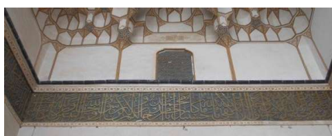
تصویر ۱۴. کتیبه سردر ورودی مسجد میرعماد.

جدول ۱۶. ویژگی‌های تاریخی، ساختاری و نوشتاری کتیبه ۱۶.