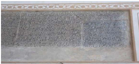
تصویر ۴. کتیبه فرمان شاه طهماسب اول.

۳. کتیبه ۵. این کتیبه فرمان دیگری از شاه طهماسب اول صفوی است. این فرمان مورخ به سال ۹۴۱ هـ.ق است و با خط نستعلیق بر روی سنگ حجاری شده است. (تصویر ۵). در این فرمان ضمن اینکه به امر به معروف و نهی از منکر اشاره شده، دستور ویران سازی تمامی مکان‌های غیرشرعی مانند قمارخانه‌ها که با شریعت منافات دارد را نیز صادر کرده تا مردم کاشان و اطراف آن به این مناهات و سایر نامشروعات روی نیاورند. «شاه طهماسب سال ۹۳۹ هـ.ق از شرابخواری توبه می‌کند» ۴ (اشراقی، ۱۳۵۳: ۲۹). برخی منابع تاریخ توبه شاه طهماسب را تا سال ۹۴۱ هـ.ق نیز می‌دانند. در این کتیبه نیز به صراحت در مورد توبه او اشاره شده که همزمانی تاریخی با کتیبه را دارد. ۵ به هرحال این کتیبه در راستای منع شرابخواری بعد از توبه شاه طهماسب روی سنگ نقر شده است. در تذکره شاه طهماسب ۶ به ممنوعیت فعالیت بیت اللطف‌ها، شراب‌خانه‌ها، بوزه‌خانه‌ها ۷ و سایر نامشروعات اشاره شده است (شاه طهماسب صفوی، ۱۳۴۳: ۳۰). (جدول ۵) «شاردن معتقد است فساد و امردبازی ۸ و نیز فواحش رسمی و غیررسمی در عهد صفوی بسیار بوده و حتی زمانی که شاه طهماسب، به قصد عوام فریبی، در سراسر ممالک