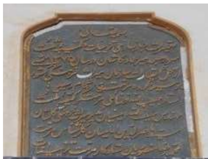
تصویر ۲۷. کتیبه مرمتی سردر ورودی مسجد (نگارندگان).

کرده است. این کتیبه در روی گچ و با خط نستعلیق نگاشته شده است. این متن حاوی تاریخ مرمت به سال ۱۳۷۵ هـ. ش نام مرمتگر، مدیر میراث فرهنگی وقت، نام کارشناس مرمت و استاد کار را در خود جای دارد. (جدول ۳۰) (تصویر ۲۷) ۳. کتیبه ۳۱. کتیبه مرمتی دیگری داخل مسجد میرعماد داخل شبستان وجود دارد. این کتیبه در ارتفاع حدود دو نیم متری نصب شده است. کتیبه مرمتی مذکور روی یک تکه سنگ مرمر سفید و با خط نستعلیق چنین نقر کرده‌اند: «بسمه تعالی تعمیر نمود مسجد میرعماد و شبستان را آیه الله العظمی آقا حسین امامی ۱۳۶۴ شمسی و ۱۴۰۶ قمری». (جدول ۳۱) (تصویر ۲۸) ۴. کتیبه ۳۲. این کتیبه مانند کتیبه مرمتی شماره ۳۱ است. در متن کتیبه پنج سطری این طور ذکر شده است: «امر به تعمیر مسجد میرعماد و بناء هدا الناحیه بعد انهدامها