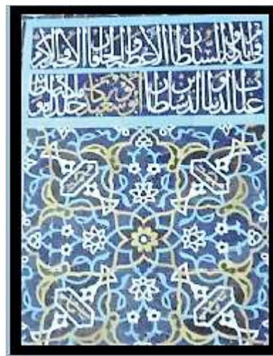
تصویر ۲۲. کتیبه منبر (نگارندگان).

جدول ۲۵. ویژگی‌های تاریخی، ساختاری و نوشتاری کتیبه ۲۵.