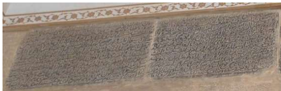
تصویر ۷. فرمان شاه طهماسب اول، مورخ ۹۸۱ هـ ق (نگارندگان).

جدول ۷. ویژگی‌های تاریخی، ساختاری و نوشتاری کتیبه ۷.