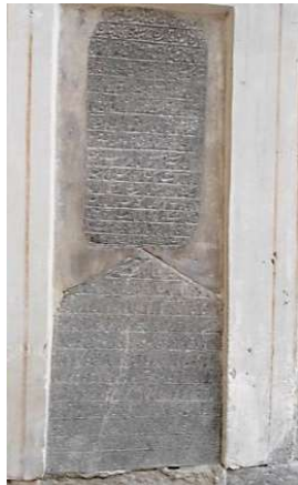
تصویر ۸. کتیبه‌های مربوط به فرمان شاه عباس اول صفوی، کتیبه‌های ۶ و ۷ که روی هم قرار گرفته‌اند، به تاریخ ۹۹۹ و ۱۰۲۲ هـ.ق (نگارندگان).

جدول ۹. ویژگی‌های تاریخی، ساختاری و نوشتاری کتیبه ۹.