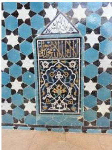
تصویر ۲۱. کتیبه دیواره شبستان زیرگنبد (نگارندگان).

داخل شبستان و زیر گنبد و در طرف راست محراب نصب شده است. این منبری با گچ و آجر بنا شده و دارای چهار متر ارتفاع و شش پله است. دو طرف آن با نهایت استادی از کاشی‌های معرق زینت شده و سالم و دست نخورده بر جای مانده است. در کتیبه سمت راست ۲۳ آن نوشته شده است: فی الایام دولته السلطان الاعظم الخاقان الافخم والاکرم ابوسعید ملکه و خلداه و سلطانه» (مشکوتی، ۱۳۴۵: ۱۳). (تصویر ۲۲) «درست در بالای این کتیبه عبارت «الحمد لله در وسط و سبحان الله و الله» بصورت خط کوفی بنایی در اطراف آن نگاشته شده است و در سمت راست آمده: «عمل حیدر کاشی تراش» و بالای همین نوشته، عبارت «یا غیاث المستغیثین اغثنی» آمده است. نوع خطوط بکار رفته ثلث است» (نراقی، ۱۳۸۲: ۱۴۹). چنانچه در تاریخ آمده ابوسعید ۲۴ در سالهای بین ۷۱۷ تا ۷۳۶ هـ. ق در