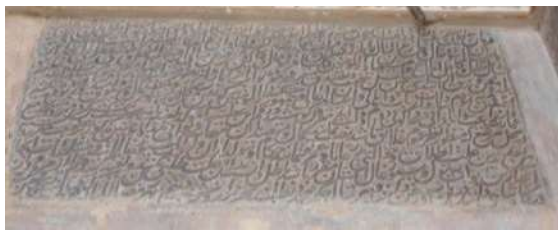
تصویر ۶. کتیبه فرمان شاه طهماسب اول، به تاریخ ۹۷۹ هـ ق.

جدول ۶. ویژگی‌های تاریخی، ساختاری و نوشتاری کتیبه ۶.