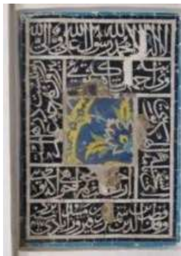
تصویر ۲۰. کتیبه زیر چراغدان که آینه اش برداشته شده و یک کاشی دیگر جایگزین آن شده است (نگارندگان).

جدول ۲۳. ویژگی‌های تاریخی، ساختاری و نوشتاری کتیبه ۲۳.