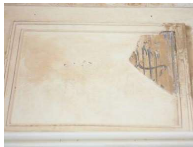
تصویر ۱۸. کتیبه‌های باقی مانده سردر ورودی زنانه (نگارندگان).

۷. کتیبه ۲۲. کتیبه‌ای در دهلیز سمت راست مسجد داخل صحنفدر روی بدنه جرز دیوار قرار دارد که شامل یک قطعه کاشی معرق است. این کتیبه در زیر چراغدان گچبری شده قرار