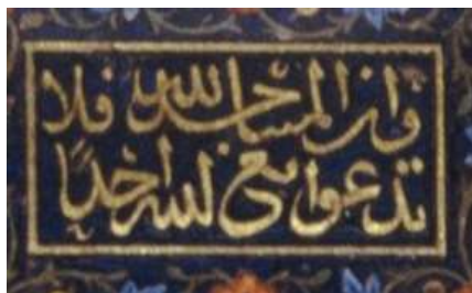
تصویر ۵. کتیبه ورودی به مسجد نگاره مستی در مسجد، محفوظ در موزه چستر بییتی.

با توجه به تفسیر معانی عمیق‌تر این آیه شریفه، در انطباق با وضعیت حیرت انگیز طرح شده در نگاره، حکایت سعدی و همچنین در مواجهه با قشری‌گری شکل گرفته در هرات،