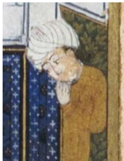
تصویر شماره ۲. جوان حیرت‌زده در نگاره مستی در مسجد، محفوظ در موزه چستربیتی، منبع: همان.