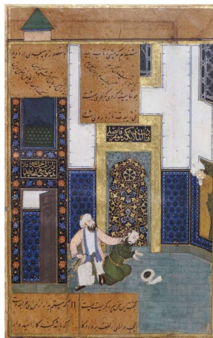
تصویر شماره ۱. نگاره مستی در مسجد، محفوظ در موزه چستربیتی

«در مقام تفتیش و تفحص معایب امین‌الدوله و اتباعش