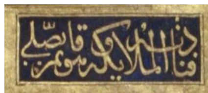
تصویر ۴. کتیبه محراب در نگاره مستی در مسجد، محفوظ در موزه چستر بییتی، منبع: همان.